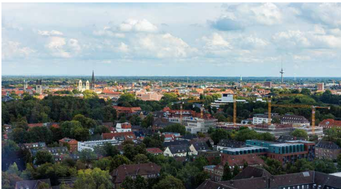
FOTO/ Einen umfassenden Blick auf Münster und das Münsterland. Links hinten der Dom.