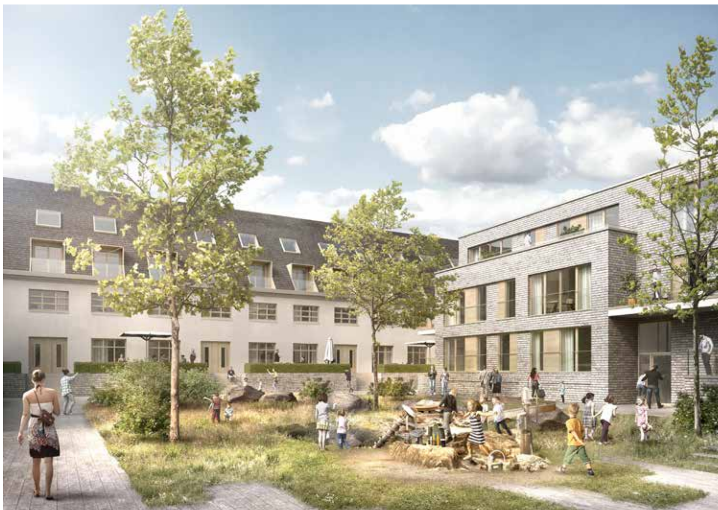
ANIMATION / Blick zum ehemaligen Mannschaftsgebäude. Visualisierung: Stadt Münster

Es ist viel los auf dem Oxford-Gelände: Im Südteil werden die Ver- und Entsorgungsleitungen bis zur Roxeler Straße verlegt, der Grüne Weiler konnte die Grundsteinlegung feiern (siehe S. 29), die Sanierung des Wachgebäudes neigt sich dem Ende zu, im Grünen Trichter wachsen die Freizeiteinrichtungen in die Höhe und gleich zwei Kitas sind im Bau.