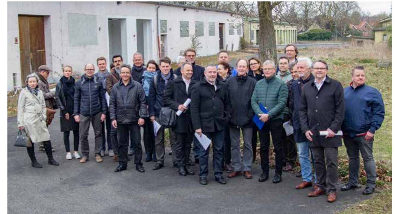
Beginn des Architektenkolloquiums der Ev. Lakas-Kirchengemeinde: Ortstermin am neuen Standort des geplanten Kirchenzentrums

Dafür, dass auf dem Oxford-Areal seit Monaten eigentlich wenig passiert, herrschte vor einigen Tagen ziemliche Unruhe. Da wurde vermeldet, die Bundesanstalt für Immobilienangelegenheiten als Untereinheit des Bundesfinanzministeriums habe einen teilweisen bis vollständigen Verkaufsstopp für die Oxford-Kaserne erlassen. Eigene Interessen des Bundes oder sogar eine Remilitarisierung im Zuge der zu erwartenden Aufstockung der Bundeswehr wurden als mögliche Gründe genannt.