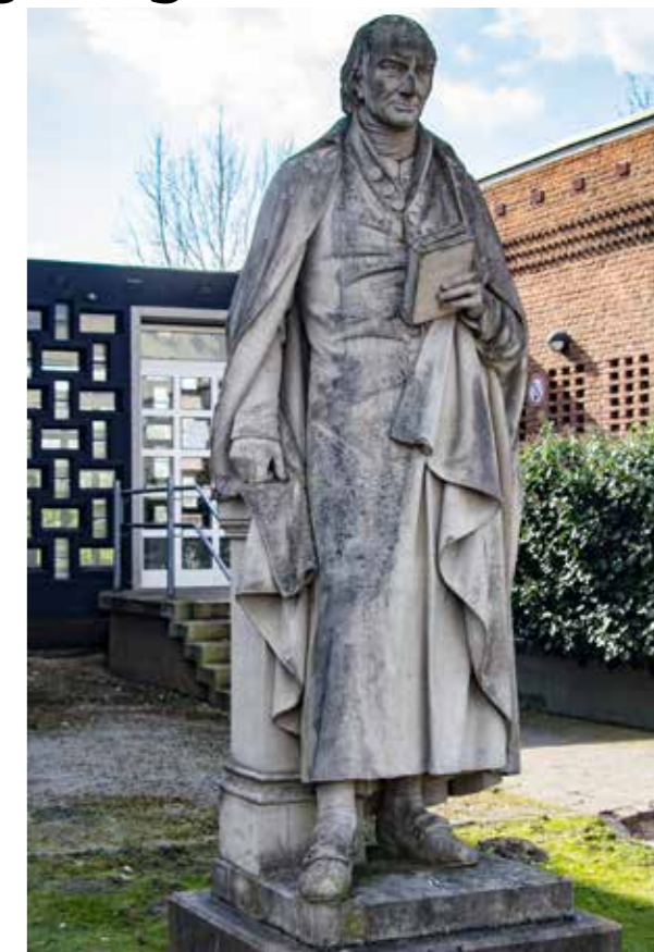
Der Namensgeber Bernhard Heinrich Overberg