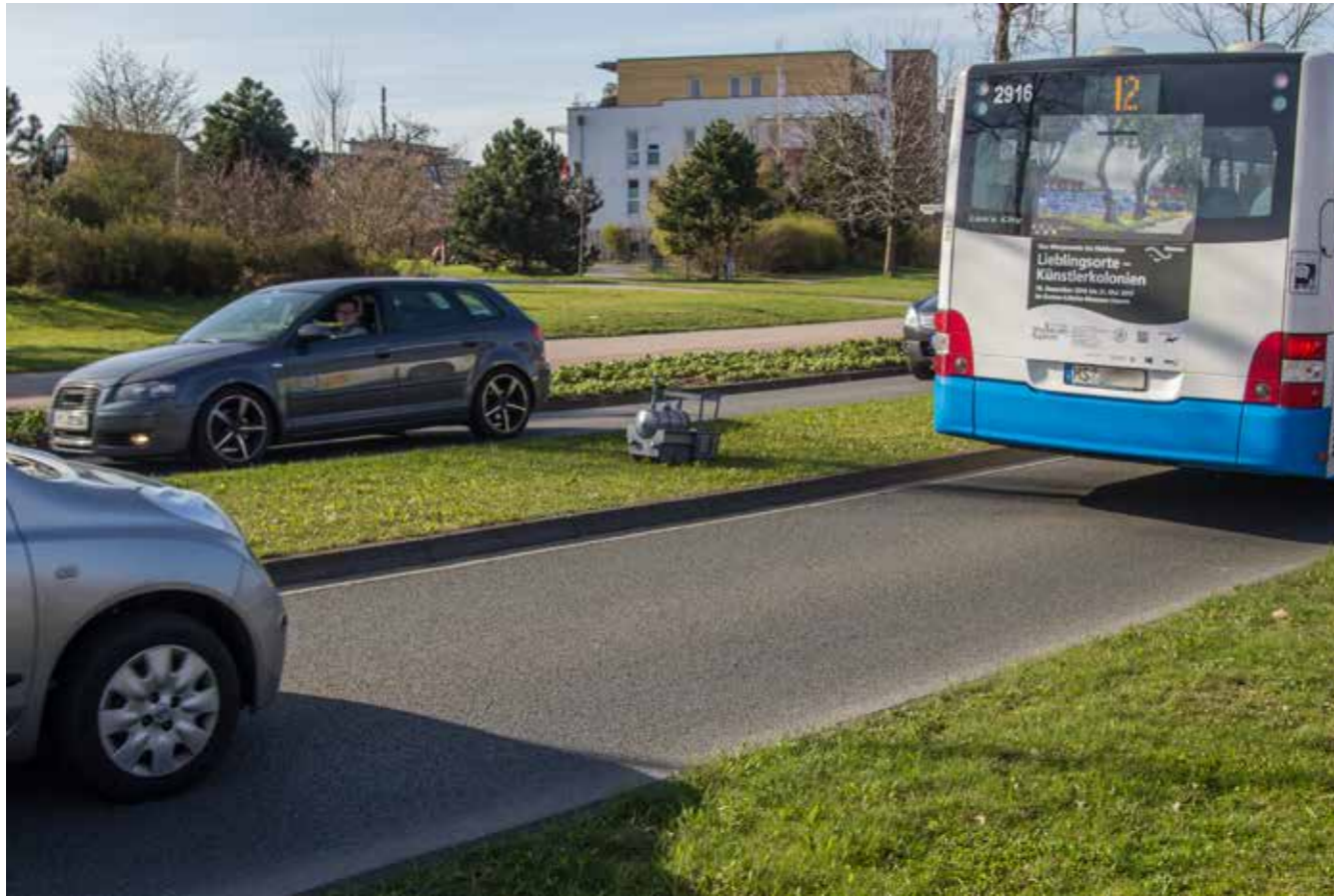
Die Trasse der Stadtbahn würde über die Dieckmannstraße verlaufen

Nur noch die alten Münsteraner erinnern sich an die Straßenbahn, die bis zum 24. November 1954 mit erheblichem Krach durch die Stadt fuhr. Die heulende Kurve vor dem heutigen „Bunten Vogel“ am Alten Steinweg muss besonders markante Geräusche produziert haben.