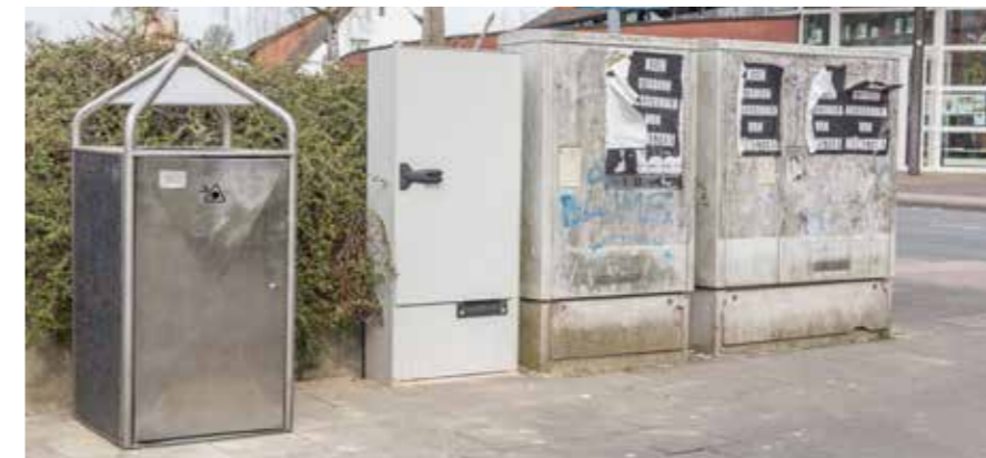
Zwei Neuerungen: Neue große Müllbehälter und ein festinstallierter Stromkasten

Sind aller guten Dinge drei? Die Vorlage zur Umgestaltung der Gievenbecker Ortsmitte soll nun im 2. Quartal 2017 in die politischen Beratungen gehen, nachdem sie schon zweimal verschoben wurde – antwortet die Fachverwaltung auf Anfrage des Gievenbecker. Im Sommer und Herbst 2015 waren die Bürgerinnen und Bürger zu zwei Workshops eingeladen, um über die Entwicklung ihrer Ortsmitte nachzudenken.