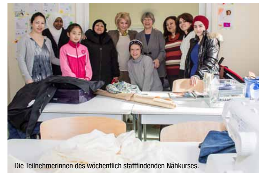
Die Teilnehmerinnen des wöchentlich stattfindenden Nähkurses.

Zentrale: Steinfurter Str. 7a 48149 MS | Tel. 0251 / 273141