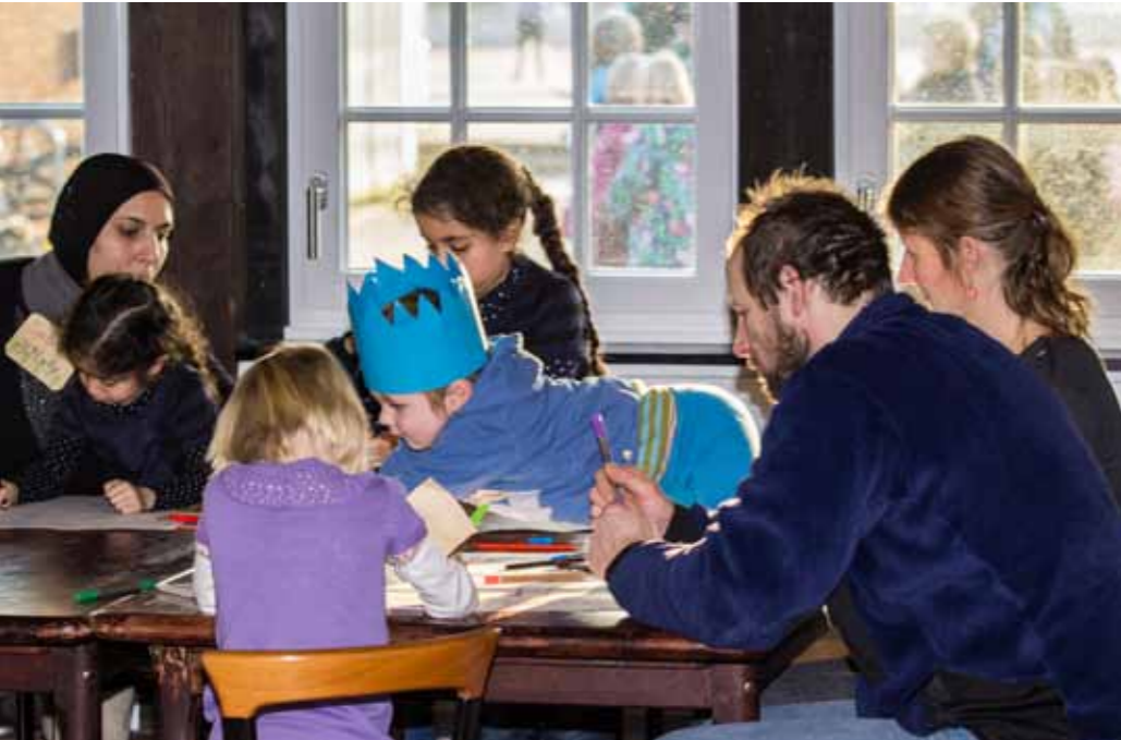
Zusammen spielen, kochen, reden: Familien verschiedener Nationalitäten lernen sich an mehreren Nachmittagen kennen – wie hier im Fachwerk. Eine Aktion des AK Flüchtlingshilfe.