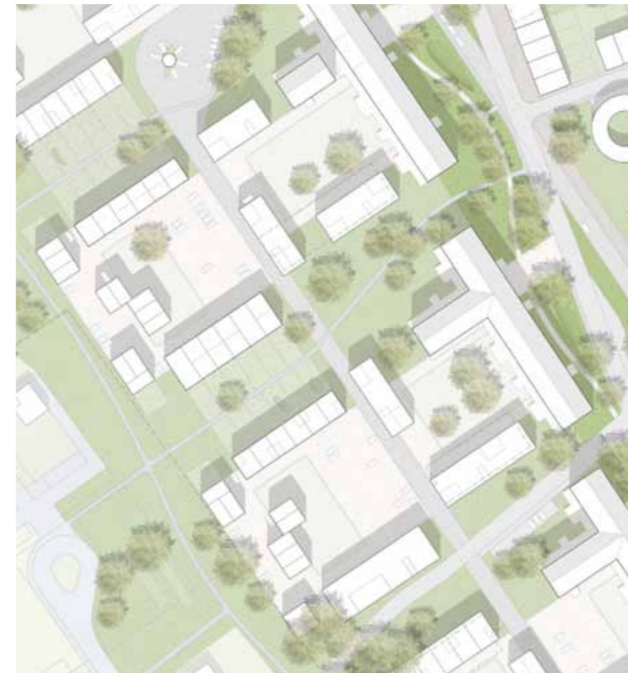
In einem dieser Wohnhöfe können sich die Initiatoren die Wohngenossenschaft mit rund 250 Mitgliedern vorstellen.

Angefangen hat es mit der Idee eines 6-Parteienhauses, die Öffnung des Oxfordgeländes und die anschließenden Bürgerworkshops haben die Überlegungen sehr beschleunigt. Wir konnten alle spüren, dass da was geht“, blickt Thorsten Liebold auf die Anfänge zurück. Danach bekam der „Grüne Weiler“ eine ungeheure Dynamik. 120 Interessierte haben sich mittlerweile gemeldet, viele von ihnen arbeiten in einer oder mehreren der Projektgruppen mit. Die Finanz-AG trifft sich wöchentlich, die Steuerungs- und Planungsgruppe trifft sich alle zwei Wochen. Auch die Bereiche Architektur, Öffentlichkeitsarbeit und Gemeinschaft werden intensiv bearbeitet, weitere Themen werden folgen. „Viele Menschen sind auf der Suche nach Perspektiven. Sie möchten nicht alleine älter werden, sondern in einer Gemeinschaft“, weiß Michaela Ar-