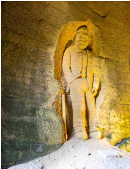
Ein überdimensionaler Bergmann.