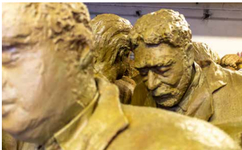
„Die Träumer“ warten in Angers auf einen neuen Einsatz.

ihrer Höhlenwohnungen, die durchaus eingehender behandelt werden könnten“, schaut Lucie Lom in die Zukunft. Wer in der Gegend ist, sollte einen Besuch einplanen. ( www.les-perrieres.com )