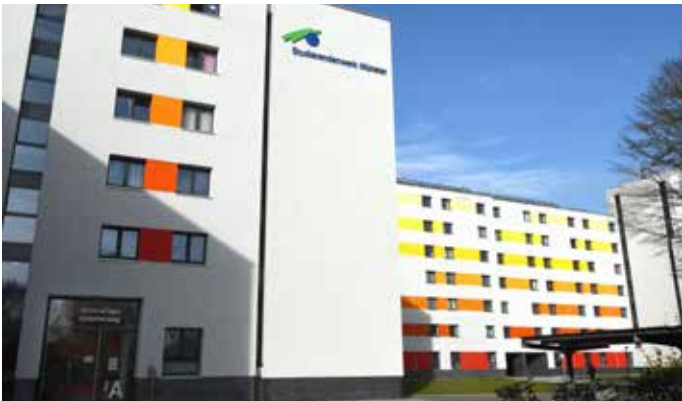
Fast Neubaustandard: 668 Studierende wohnen in der umfassend sanierten Wohnanlage am Gescherweg.

Bezahlbarer Wohnraum ist knapp in Münster. Gerade Studierende, die zum Semesterstart neu ankommen, können ein Lied davon singen. Vor allem im Herbst gibt es regelmäßig Engpässe. Die rund 5 400 Wohnplätze, die das Studierendenwerk Münster anbieten kann, sind früh vergeben. Auf der Homepage finden Wohnungssuchende fast immer nur den Hinweis „Verfügbarkeit: 0 Einheit/en“. Die regelmäßig eingerichteten Notunterkünfte in der Wohnanlage „Wilhelmskamp“ an der Steinfurter Straße helfen wenigstens temporär, wenn sonst gar nichts geht.