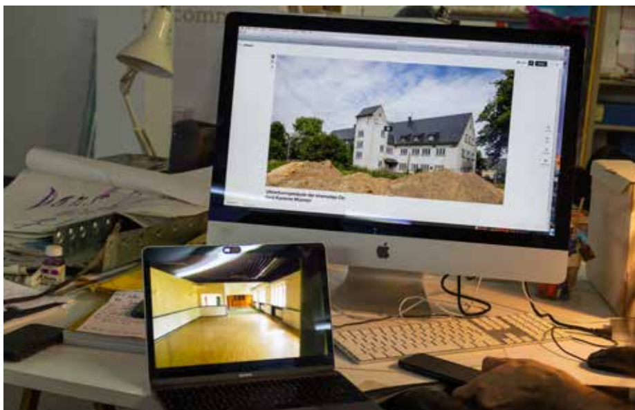
Innen und Außen: Virtueller Ortstermin im Uhrenturm.

Lange Zeit standen dort die Lan Kathedralen erinnern den Gewölbe der ehemaligen Steinbrucharanlage leer und waren ungenutzt. Bis in die 1940er Jahre wurde hier in mühevoller Handarbeit das tertiäre Muschelsandgestein abgebaut und hauptsächlich für den Haus- und Mauerbau in der Umgebung verwendet. Aufgrund seiner Beschaffenheit finden sich in den Steinen unzählige Spuren von Pflanzen, Muscheln und Tieren. Zwar bestand schon seit einiger Zeit der Wunsch nach einer öffentlichen Nutzung, es war aber schlicht kein Geld für die Umsetzung vorhanden. 2014 konnte „Lucie Lom“ schließlich mit einem sehr überschaubaren Etat die künstlerische Leitung für die Entdeckungsreise durch zehn Millionen Jahre Erdgeschichte übernehmen. Mit Licht, Ton und Film wird das Publikum durch die unterirdische Welt geleitet. Auf den Spuren von urzeitlichen Pflanzen und Tieren führt der Weg entlang - von der Entwicklung des Ozeans über eine riesige Sanddüne bis zu einem Ort des Bergbaus. Die KünstlerInnen kommen dabei ohne einen didaktischen Ansatz aus, sondern sie ermöglichen es jeder Besucherin und jedem Besucher ganz individuell Eindrücke und Informationen zu sammeln und so der Geschichte des einzigartigen Raums nachzuspüren. „Das Falun-Mysterium ist ein Abenteuer, das noch lange dauern kann! Es ist ein so reiches Thema. Es gibt beispielsweise die ganze menschliche Dimension der Bergleute, ihrer Arbeit und