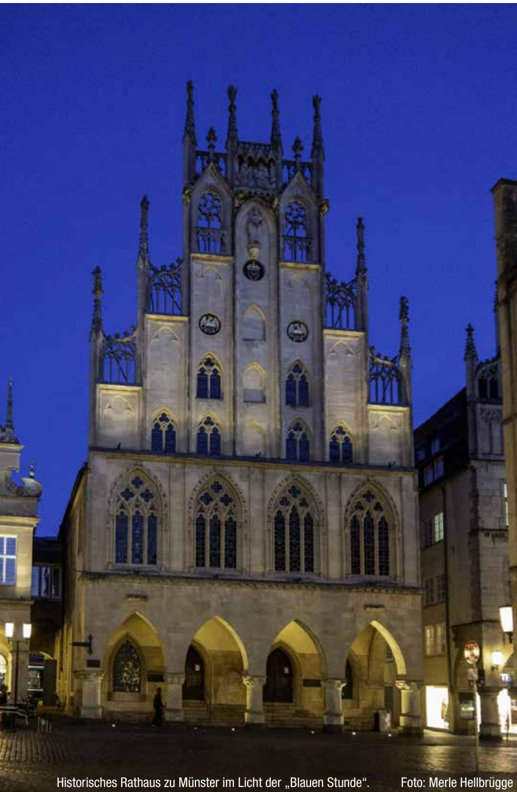
Historisches Rathaus zu Münster im Licht der „Blauen Stunde“.