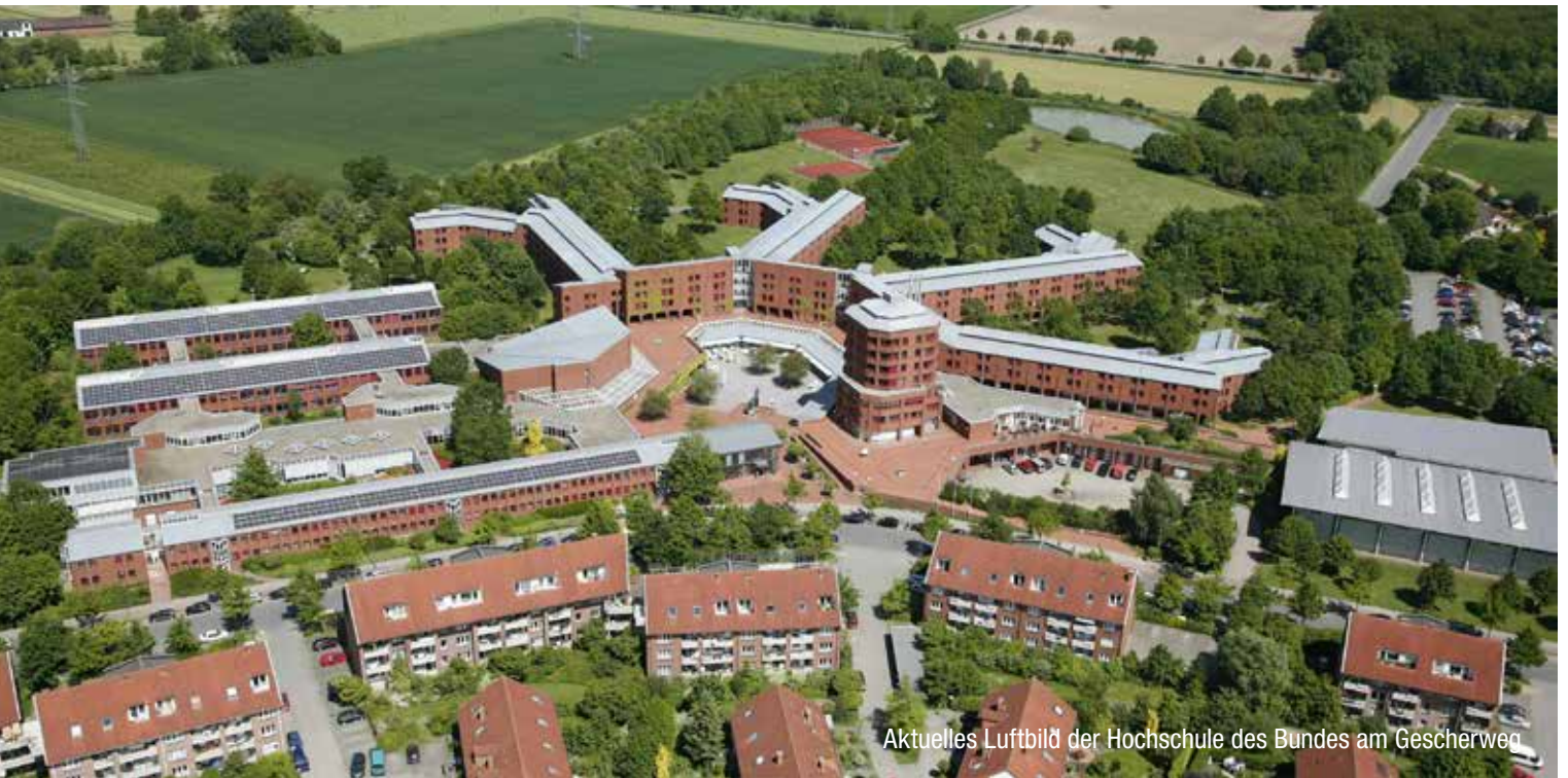
Aktuelles Luftbild der Hochschule des Bundes am Gescherweg

I m Volksmund heißt sie Bundesfinanzschule, ganz korrekt wäre aber Fachbereich Finanzen der Hochschule des Bundes für öffentliche Verwaltung in Münster. Der Hauptsitz der 1979 gegründeten Hochschule ist in Brühl, weitere Abteilungen anderer Bundesverwaltungen finden sich beispielsweise in Kassel, Langen, Lübeck, Mannheim oder Wiesbaden.