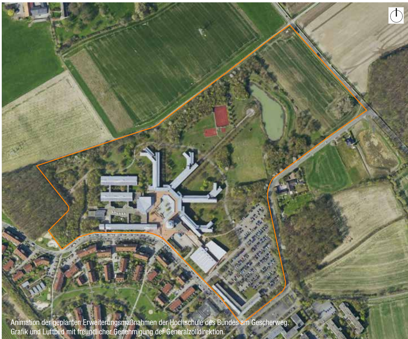
Animation der geplanten Erweiterungsmaßnahmen der Hochschule des Bundes am Gescherweg. Grafik und Luftbild mit freundlicher Genehmigung der Generalzolldirektion.

den Gebäude im wesentlichen aufgestockt bzw. verlängert werden. Einige Neubauten werden auf den bisherigen, recht großzügigen Freiflächen des Areals realisiert.