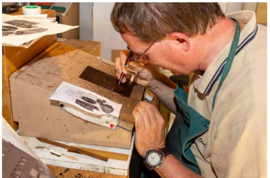
Der Meister bei der Übertragung eines Motivs auf eine Kupferplatte als Radierung.

„Mein Vater war Bibliothekar und sammelte Exlibris. Das hat mich beeinflusst und zu diesem