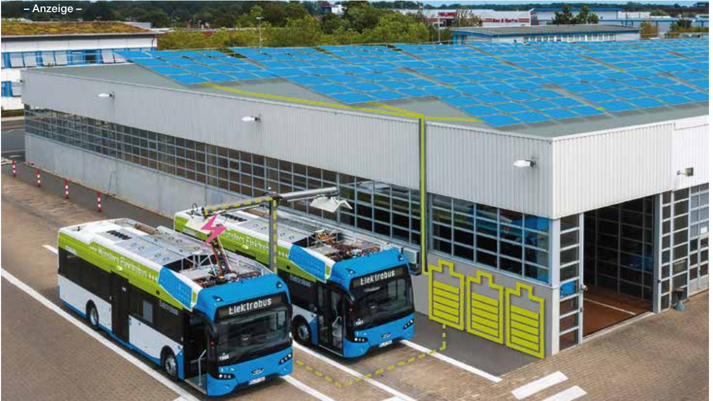
Sonnenenergie speichern die Stadtwerke auf ihrem Betriebshof in einem stationären Batteriespeicher. Der grüne Strom fließt in die Elektrobusse.