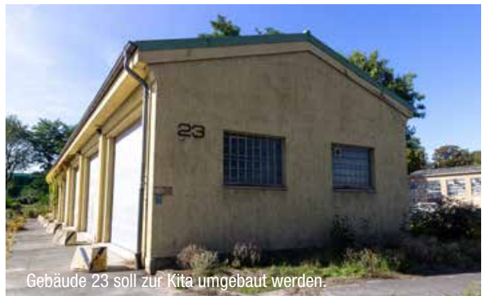
Gebäude 23 soll zur Kita umgebaut werden.

Das eine zweizügige Grundschule auf dem Oxford-Quartier geplant ist, dürfte niemanden überraschen. Die entsprechenden Planungen (s. Vorlage 0696/2019) – fast die Hälfte des als Bürgerzentrums vorgesehenen Uhrenturmgebäudes soll hierfür verwendet werden – erstaunt dann