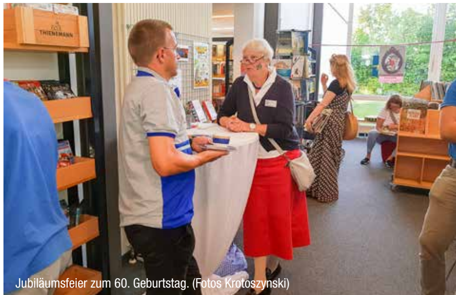
Jubiläumsfeier zum 60. Geburtstag.

liothek wuchs allerdings erst heran, als nach dem Bau des Pfarrhauses 1961 ein Raum in der 1. Etage eingerichtet und unter der Leitung von Ursula Windeck immer bekannter wurde.