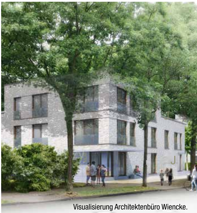
Visualisierung Architektenbüro Wiencke.

planerischen Freiheiten groß. Fest stand beispielsweise, dass möglichst viele Bäume erhalten werden müssen. Auch an einer Umsetzung in Bauabschnitten, damit MUM und das Topp direkt vom Alt- in den Neubau mit einem Raumprogramm von 315 bzw. 248 Quadratmetern ziehen können, war nicht zu rütteln. Um die historische Bedeutung des jetzigen Bestandsgebäudes als Teil des Lagers Toppheide zu würdigen, sollten die Planer eine entsprechende Möglichkeit vorschlagen. Dafür fanden sich keine Vorgaben zur Größe und Menge der Wohnungen, so dass es hier eine Schwankung zwischen 3800 und 8000 Quadratmetern gab – der Siegerentwurf liegt in der Mitte.