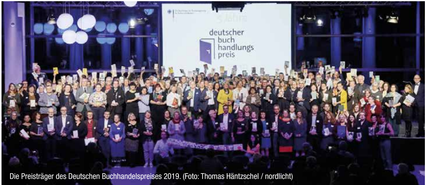
Die Preisträger des Deutschen Buchhandelspreises 2019.