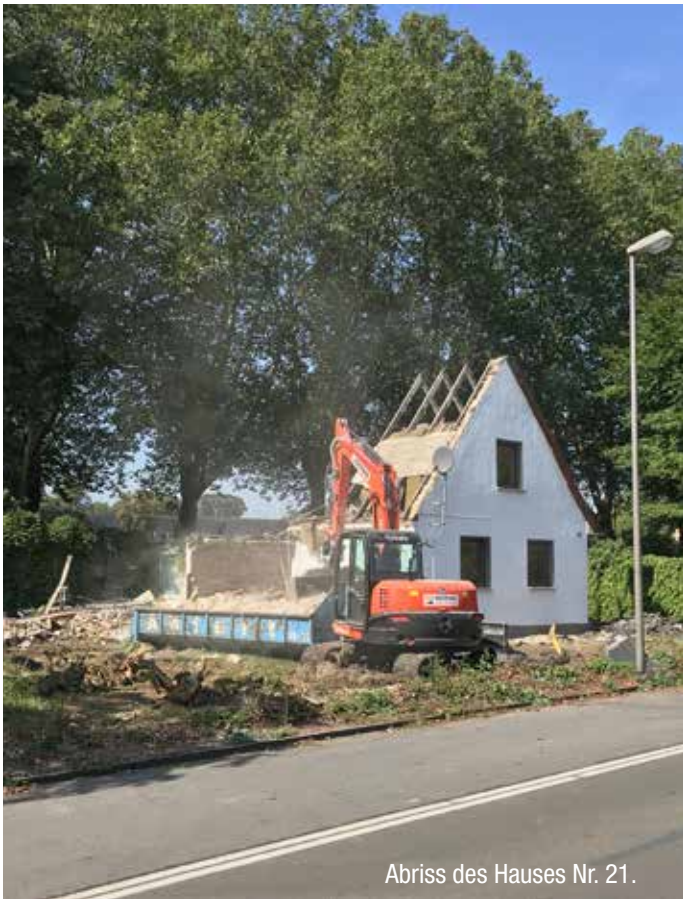
Abriss des Hauses Nr. 21.

ford-Kaserne ist im Bebauungsplan entsprechend ihrer stadtstrukturellen Bedeutung als öffentliche Grünfläche ausgewiesen. Außerdem spielt die Gievenbecker Reihe im Erschließungskonzept für das Oxfordquartier eine bedeutende Rolle. So soll der Geh- und Radweg durchgängig von der Fahrbahn abgesetzt geführt werden, da sich das Aufkommen an Fuß- und Radverkehr in den kommenden Jahren dort erheblich steigern wird (vgl. Bebauungspläne Nr. 410 und Nr. 579).“