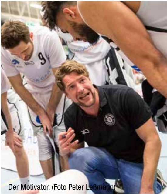
Der Motivator.

Triumphe beim Schulwettbewerb „Jugend trainiert für Olympia“ in Berlin. Das färbt auch auf den Verein ab.