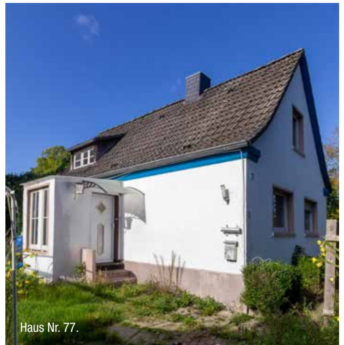
Haus Nr. 77.

In den 90er Jahren änderte sich für die Bewohnerinnen und Bewohner die Situation. Spätestens mit dem seit dem 25. August 1998 gültigen Bebauungsplan 410 bestand kein Zweifel mehr daran,