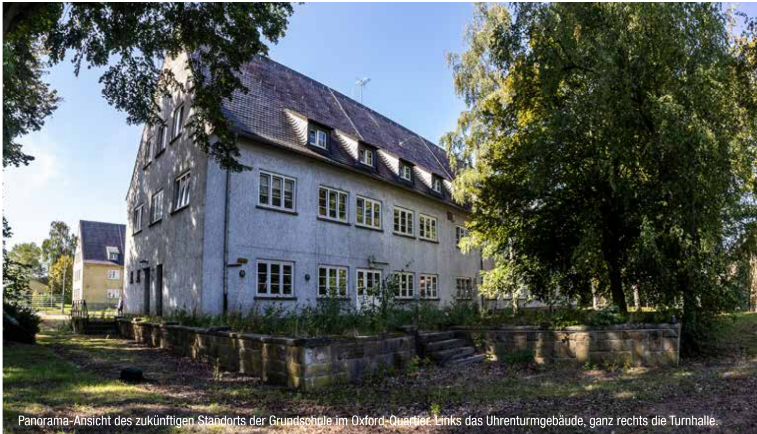
Panorama-Ansicht des zukünftigen Standorts der Grundschule im Oxford-Quartier. Links das Uhrenturmgebäude, ganz rechts die Turnhalle.

neu bauen müssen“, erläutert der Konversionsmanager. Da dies nicht auf der grünen Wiese, sondern im teils denkmalgeschützten Bereich passiere, verlängere sich die Bauzeit. „Aber auch hier werden wir in der ersten Jahreshälfte schon sichtbar vorangekommen sein. Die erforderlichen Ausschreibungen laufen derzeit.“