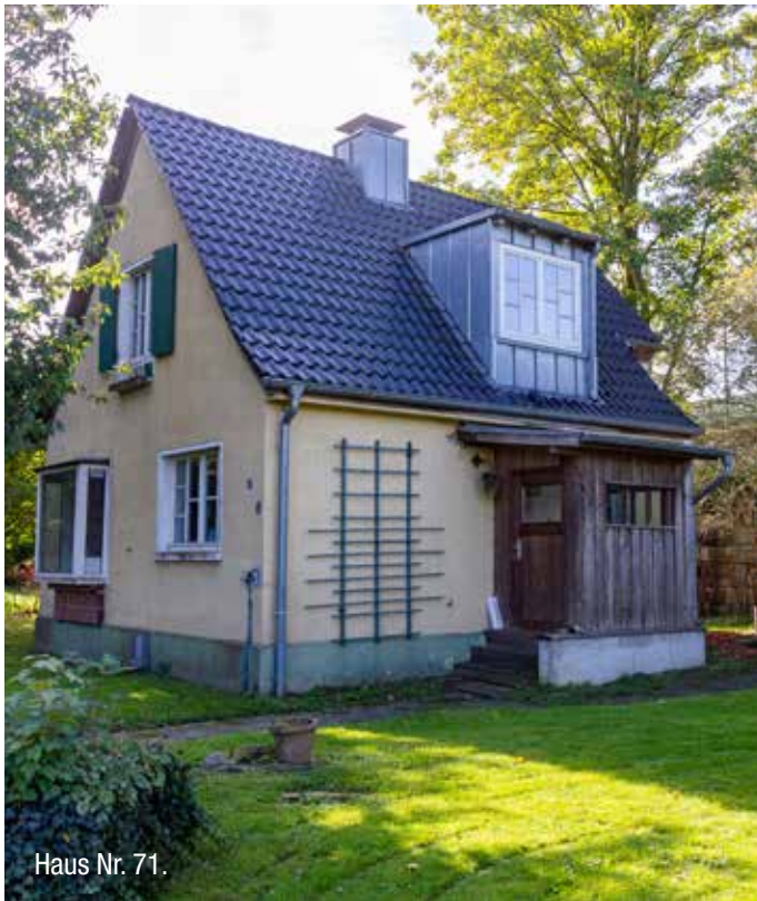
Haus Nr. 71.

waren nicht die ersten Gebäude an dieser Stelle, denn noch einige Zeit nach Kriegsende wurde die Holzbaracke, die für die Bauleitung der Kaserne errichtet worden war, genutzt. Kriegsflüchtlinge aus Ostpreußen oder dem Sudetenland wohnten dort, so auch Peter Demling, Gründer des 1. FC Gievenbeck und Namenspate für die Sporthalle im Sportpark. 1962 wurde dann als letztes das neue Gerätehaus für die Freiwillige Feuerwehr Gievenbeck eingeweiht.