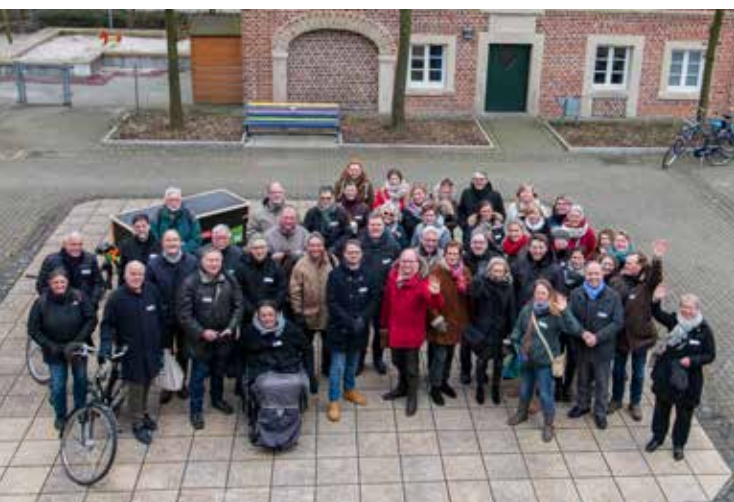
Teilnehmer Zukunftsspaziergang 2018

Es ist eine herzliche Begrüßung. Knapp zwei Jahre nach dem Zukunftsspaziergang am 17. März 2018 haben sich die Organisatoren von damals im MuM auf einen Kaffee verabredet. Immer wieder sind sich in der Zwischenzeit zwar die einzelnen Mitglieder begegnet, haben untereinander gesprochen oder auch zusammen gearbeitet – ein Treffen in dieser Runde hat es aber nicht mehr gegeben.