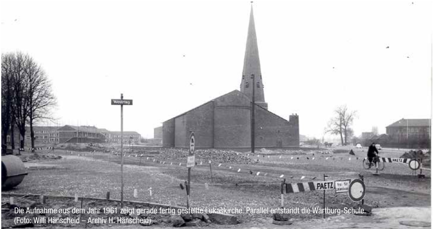
Die Aufnahme aus dem Jahr 1961 zeigt gerade fertig gestellte Lukaskirche. Parallel entstand die Wartburg-Schule.

Erneut wird das Areal neben der Lukaskirche sein Gesicht verändern: Auf dem Gelände der ehemaligen Wartburg-Hauptschule entsteht ein kleines neues Stadtquartier, das voraussichtlich Mitte bis Ende 2023 fertiggestellt sein könnte und dann Wohnungen, einen Lidl-Markt, Bäckerei oder Café sowie Betreuungsplätze für Vorschulkinder vereint. Ende des vergangenen Jahres hatte der Rat der Stadt mit der Änderung des Flächennutzungsplanes die bisher vorgesehene Grundstücks-Nutzung für eine Schule aufgegeben und durch den Auftrag zur Aufstellung eines Bebauungsplanes grünes Licht für das Vorhaben gegeben.