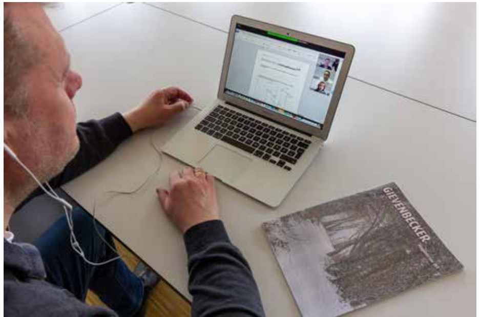
Gelungener Praxis-Test: Online-Interview durch den GIEVENBECKER.

I n den naturwissenschaftlichen Fächern verwandelt sich der Bildschirm auch in ein Whiteboard, auf dem Rechen-