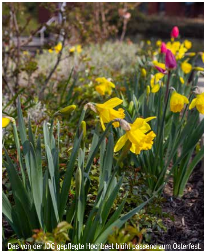
Das von der IOG gepflegte Hochbeet blüht passend zum Osterfest.

D ie Fahrschule Ulf Imort muss mit dem Unterrichtsbetrieb derzeit pausieren. Anmeldungen und Beratungen sind allerdings online und zwischen 12:00 und 15:00 Uhr per Telefon