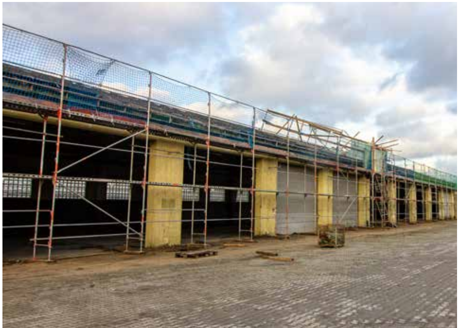
Auch diese ehemalige Panzerhalle ist abgerissen worden.

D ie Trasse befindet sich in städtischem Eigentum und wurde vor einigen Jahren schon einmal als Baustraße genutzt. Damalige Bemühungen, das Provisorium in eine dauerhafte Einrichtung zu