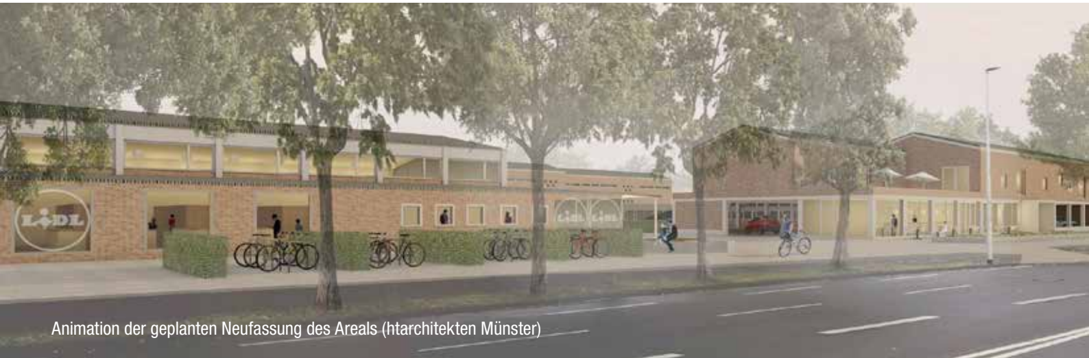
Animation der geplanten Neufassung des Areals (htarchitekten Münster)

mit vielfältigem Nutzungsmix weiterentwickelt werden“, heißt es in einer städtischen Pressemitteilung. Zu diesem Spektrum sollen neben den Wohnungen - rund 500 Quadratmeter der vorgesehenen Wohnfläche werden als öffentlich geförderter Wohnungsbau realisiert - auch eine Bäckerei oder ein Café sowie eine achtgruppige Kindertageseinrichtung und als ergänzendes Angebot Räume für Tagesmütter beitragen. Als Aufenthaltsort für Einkäufer und Bewohner ist ein Quartiersplatz vorgesehen, der durch die ergänzende Bebauung in Richtung Von-Esmarch-Straße seine Abgrenzung finde, wie die Architektin bei der Vorstellung der Pläne erläuterte. Grundsätzlich, so betonen alle mit der Planung beschäftigten Partner aber, solle die Gesamtstruktur des heute zum großen Teil leer stehenden Gebäude-Denkmal weiterhin erkennbar bleiben.